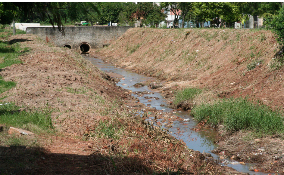
Trabalho foi realizado no córregos do Jardim São Domingos e Alvorada

A Administração Regional do Jardim Picerno e do Centro realizaram nessa semana um trabalho de limpeza nos córregos que cortam o jardim São Domingos e o jardim Alvorada.