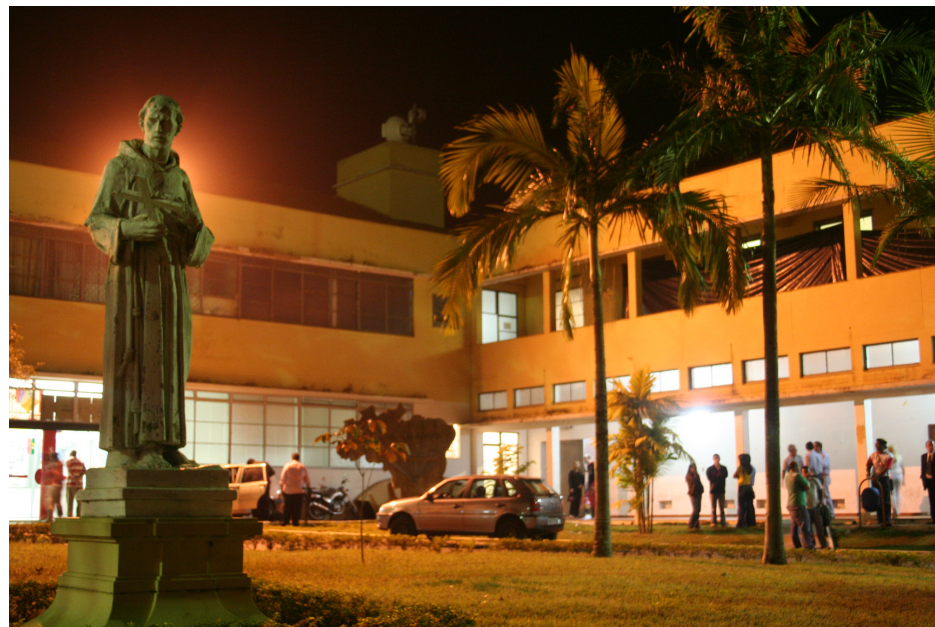
Prédio do Centro Administrativo de Nova Veneza permanecerá às escuras durante a atividade da Hora do Planeta

A Secretaria Municipal de Defesa, Proteção e Preservação do Meio Ambiente orienta para que as pessoas que queiram participar da Hora do Planeta e informar a sua adesão, podem acessar o sítio www.horadoplaneta.org.br e se cadastrar.