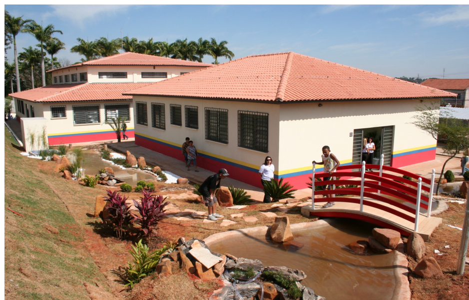
Reunião para assinatura de termo de adesão acontece no Centro da Terceira Idade

21, às 10hs, para assinatura do termo de adesão aos programas. O encontro será no Centro de Convivência da Terceira Idade, que fica na Avenida Brasil, nº. 1.111, Jardim Nova Veneza (ao lado do Centro Administrativo). Estão sendo destinados R$ 540 mil pelo Programa Novo Começo e R$ 972 mil pelo AME. A Habitação informa que no Novo Começo haverá depósito único de R$ 1 mil a cada família cadastrada. No AME serão destinados R$ 300 às famílias, podendo ser estendido até seis meses desde que seja comprovada a necessidade de continuidade no programa.