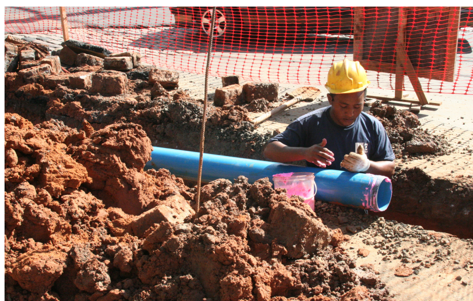
Esta semana os trabalhos se concentraram nas imediações da rua José Maria Miranda

A Prefeitura de Sumaré está finalizando o serviço de interligação do novo sistema de distribuição de água localizado no quadrilátero central. Face as obras, a Prefeitura informa que o trânsito, nos locais a rede recebe intervenção, poderá apresentar lentidão. Por isso, o motorista deve redobrar a atenção. De acordo com informações da Secretaria de Obras, no total, estão sendo executadas cerca de 200 ligações do sistema de distribuição com os lotes e empreendimentos comerciais. No segundo semestre do ano passado foram instalados 2.555 metros de rede de distribuição, cujo objetivo era conter as perdas de água. A tubulação antiga, datada do ano de 1950, feita em ferro, apresentava problemas de vazão e baixa pressão. Por esse motivo a sua substituição se tornou necessária. Estão sendo investidos, por meio do Programa de Aceleração do Crescimento (PAC) R$ 382.947,37 em uma nova tubulação em PVC, material mais flexível e que garantirá