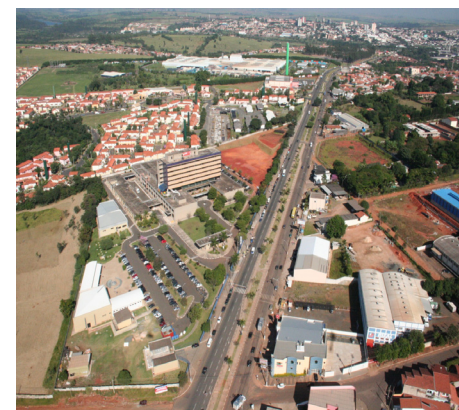
Saldo de emprego cresce na cidade

O resultado é o maior dos últimos cinco anos e Sumaré vem vivendo boa fase na atração de novos empreendimentos, o que acarreta na geração de oportunidades de emprego. A política de incentivos fiscais tem atraído cada vez mais investidores para a cidade. O Posto de Atendimento ao Trabalhador (PAT), localizado no Centro Administrativo de Nova Veneza, vem correspondendo, sendo o principal mecanismo utilizado pelo empresariado na contratação de profissionais. No