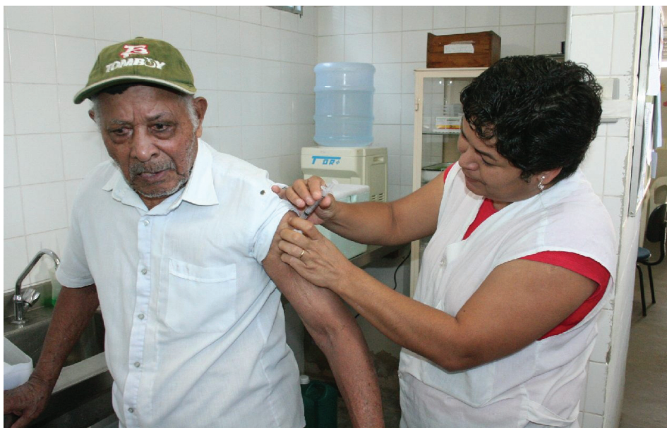
Secretaria pretende vacinar mais de 80% da população idosa, repetindo a ação do ano passado, quando foram vacinadas 15.575 pessoas

A Secretaria Municipal de Sumaré, por meio do Departamento de Vigilância Epidemiológica, informa que a Campanha contra a Influenza (gripe), este ano, ocorrerá no período de 25 de abril a 13 de maio, sendo o Dia "D", 30 de abril. A Secretaria pretende vacinar mais de 80% da população idosa, repetindo a ação do ano passado, quando foram vacinadas 15.575 pessoas acima de 60 anos, o que equivale a 80,5% da população nesta faixa etária. A Vigilância Epidemiológica do município já fez o pedido de mais de 34 mil doses de vacina, já que esse ano, os idosos não são o único grupo a ser vacinado. As gestantes, crianças com mais de seis meses e menos de dois anos, trabalhadores da área de saúde e população indígena também deverão procurar os postos de vacinação para receber a dose. Segundo a coordenação da Vigilância Epidemiológica, a vacina será estendida para outros grupos de moradores sumareenses devido à imunização con-